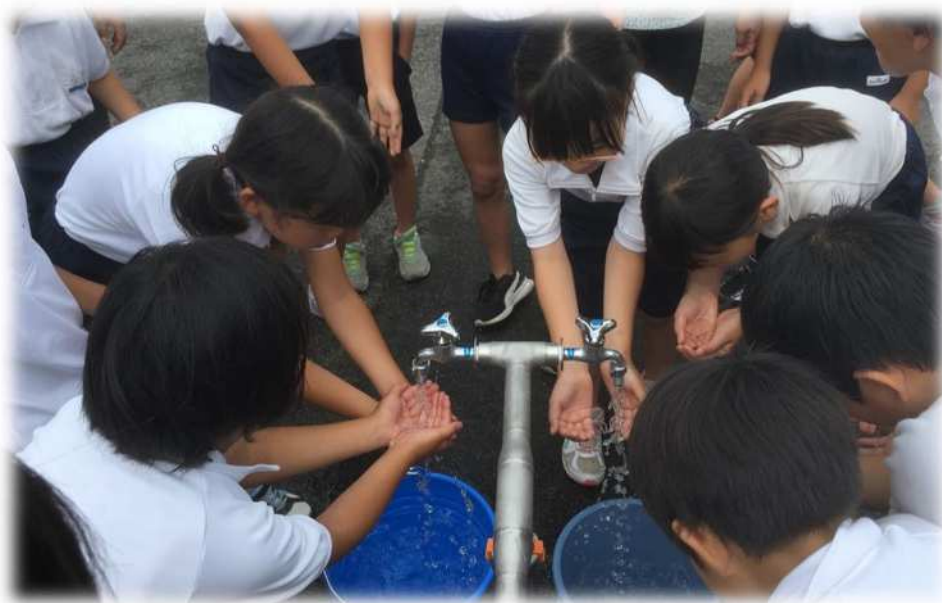
▲ 小学生の施設見学

その他の項目の検査については、別添水質検査項目一覧表に掲げる検査頻度により行います。