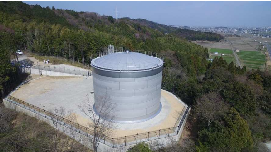
【相川左岸低区配水池】