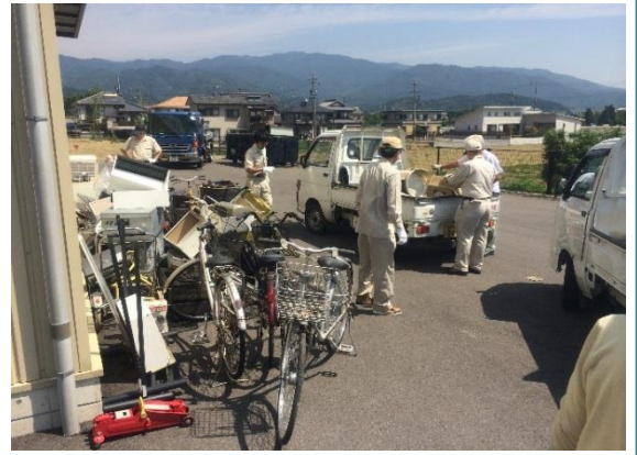
金物類回収イベントの様子