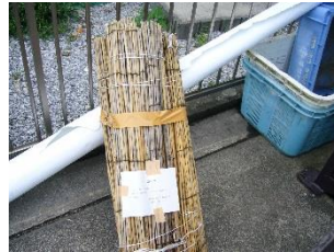
すだれ、よしすなど