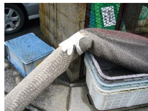
カーペット、布団など