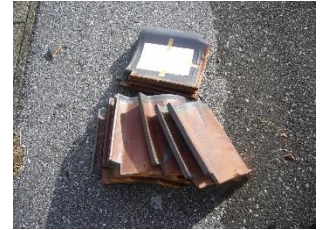
瓦、コンクリートなど