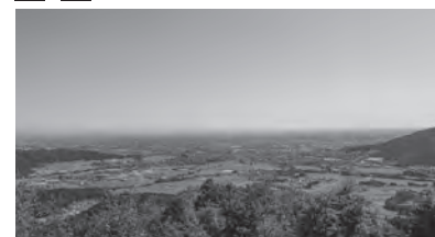
▲菩提山城跡からの景色