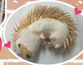
集学舎 (子ども教室)

祝北中学校創立50周年記念 特別企画 写真展 レンズの向こうにまちの主役 ～過去・現在・そして繋がる未来～