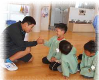
不破中学校の皆さん