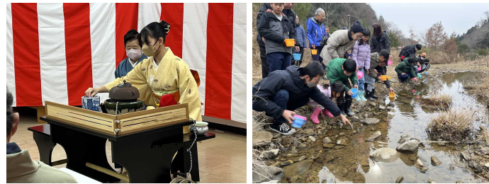
新春お茶会 ホテルの幼虫放流会