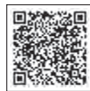
▲ぽかぽかタイムホームページ