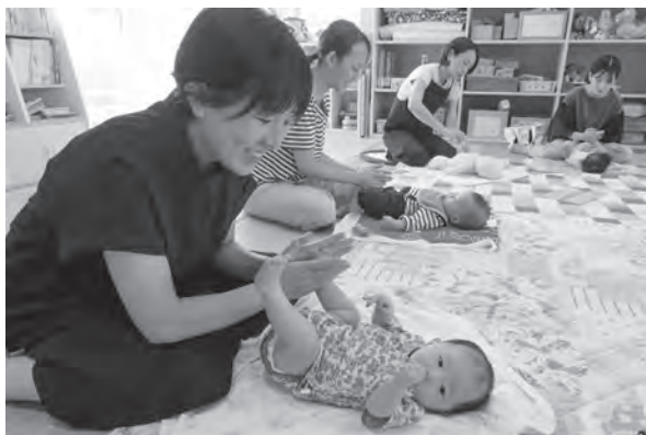
ベビーマッサージの様子