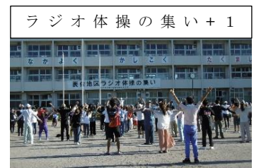
ラジオ体操の集い+1