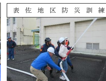
表佐地区防災訓練