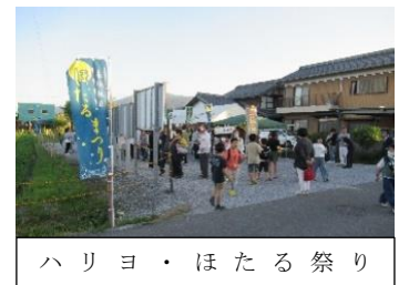
ハリヨ・ほたる祭り