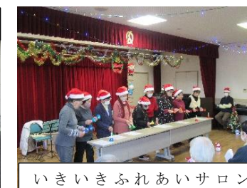
いきいきふれあいサロン