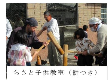
ちさと子供教室（餅つき）