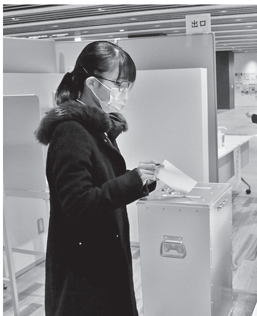
▲ 期日前投票をする新有権者