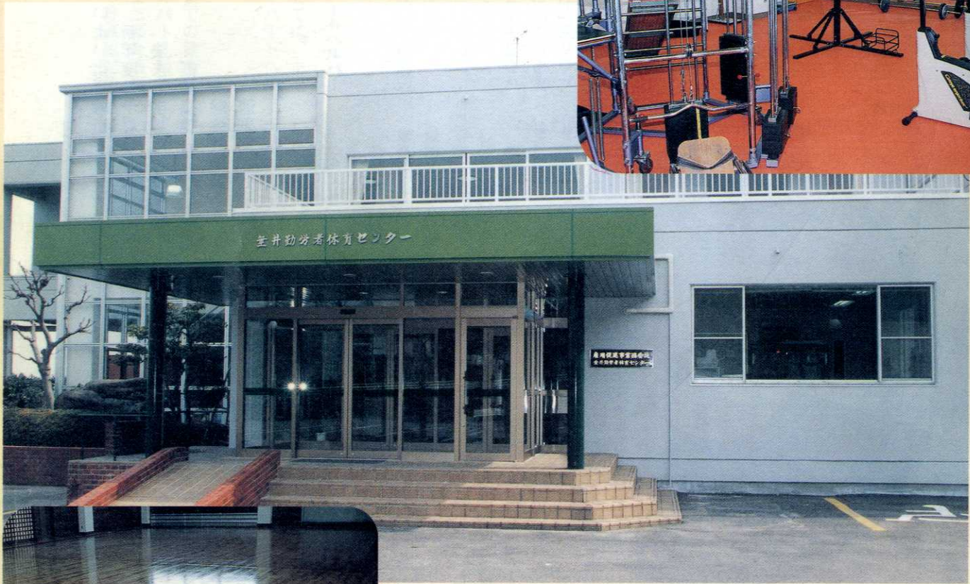
リフレッシュした勤労者体育センター