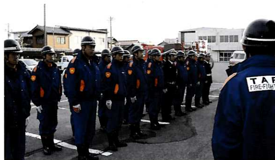
▲郡消防連合演習のため集まった垂井分団のみなさん

※防寒ジャンパーは、「消防団員等公務災害補償等共済基金」により、全団員に貸与されました。