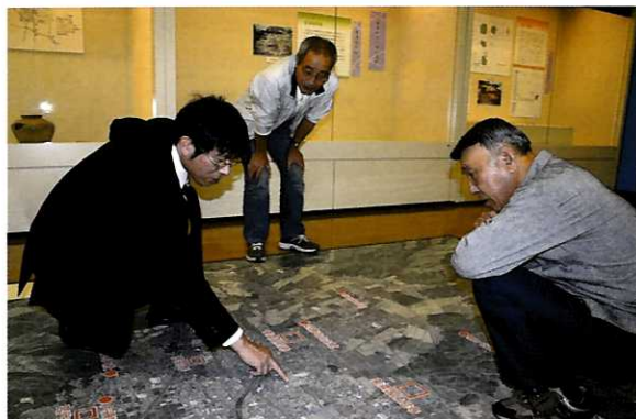
▲「1日居ても飽きない」という熱心な来館者も

12月12日(日)まで、タレイピアセンターで開催中の第45回企画展。テーマは「～わかってきた垂井の古代～美濃国分尼寺展」です。