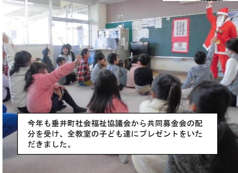
今年も垂井町社会福祉協議会から共同募金会の配分を受け、全教室の子ども達にプレゼントをいただきました。