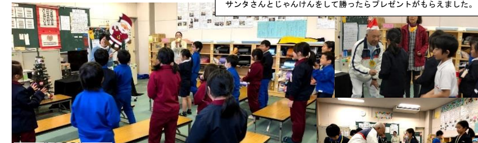
「あわてんぼうのサンタクロース」を歌いました。かわいいサンタクロースの登場に子ども達から笑みがこぼれました。