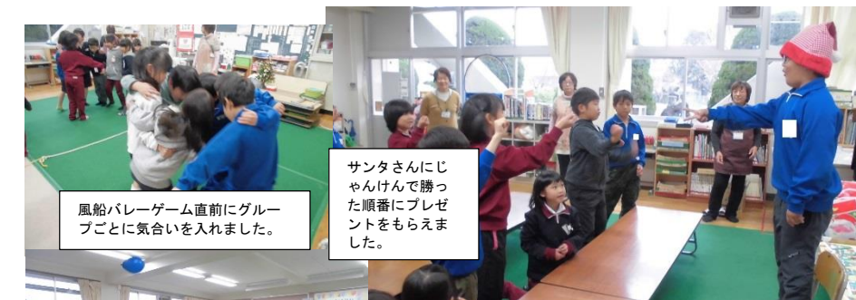
広がった教室で2コート作って風船バレーゲームをしました。低学年も高学年も力を合わせて頑張りました。