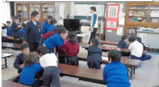
伝言ゲームをしました。最後までうまく伝言できずに伝わった言葉がおもしろくて、子ども達は大笑いでした。