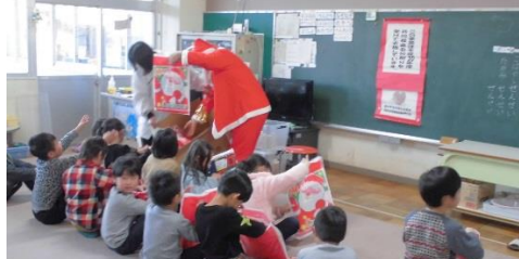
今年も全教室でプリンアラモードを食べました。アレルギーの子ども達はアレルギー対応のケーキです。グレードアップしたケーキに子ども達は大喜びでした。