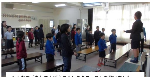
みんなで「あわてんぼうのサンタクロース」を歌いました。

平成 31 年 1 月 健康福祉課 子育て支援係 発行 12月は、全教室でクリスマス会を行いました。