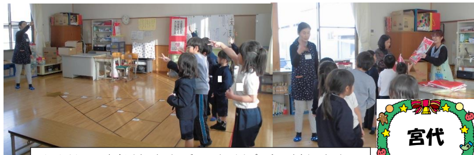
じゃんけんツリーすごろくをしました。ゴールした子からプレゼントをもらいました。