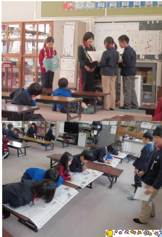
思い出ありがとう集会