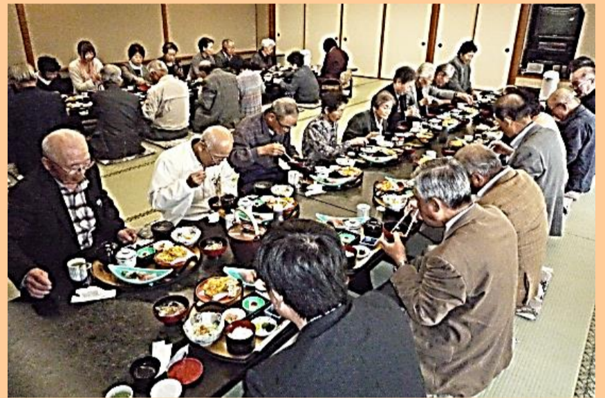
よく歩いた後のお昼ご飯「ご馳走様でした！」