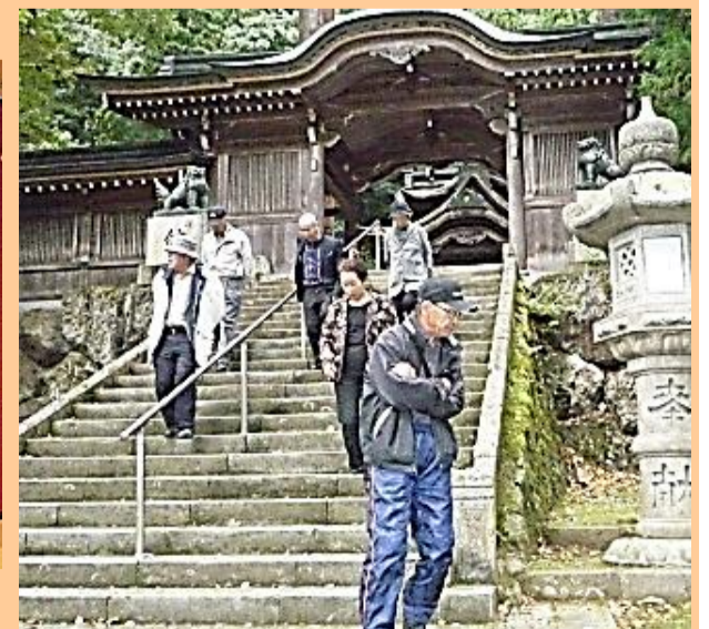
(紙祖神)岡太神社・大滝神社参拝