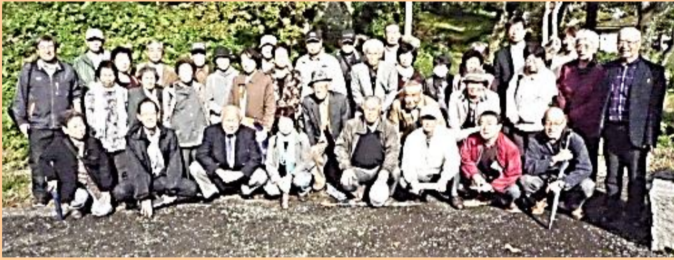
府中歴史教室 町外研修の参加者の皆さん(小丸城跡にて)