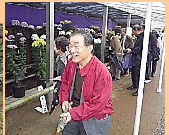
たけふ菊人形の会場にて