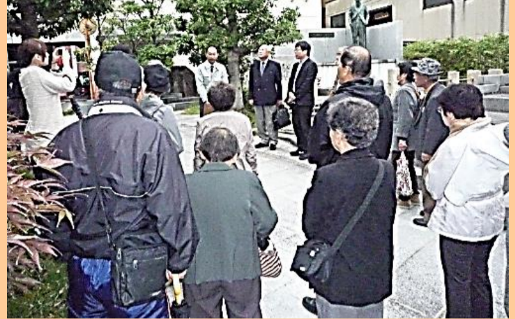
越前市役所前で当地の国府の説明を聞く