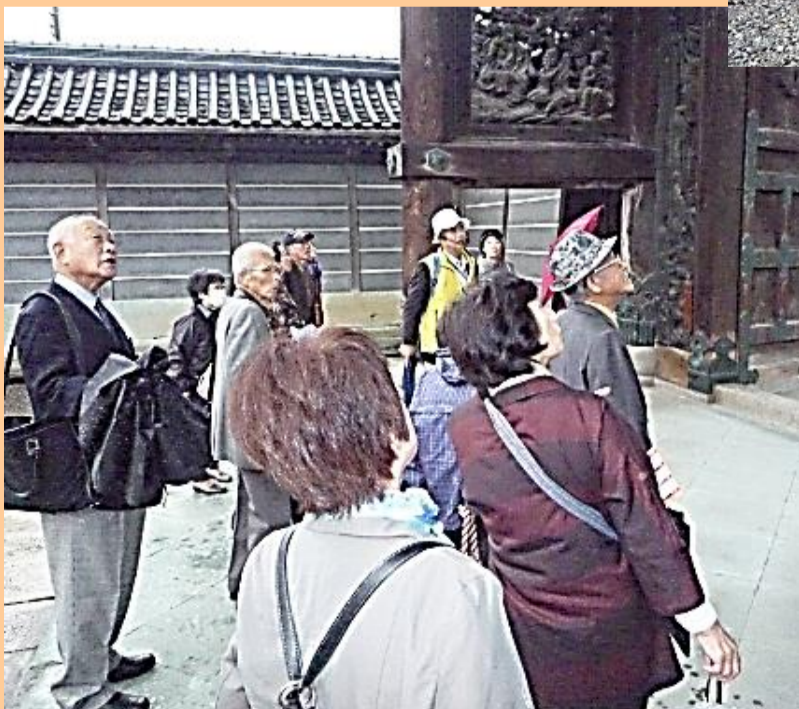
毫摂寺(真宗出雲路派の本山)にて