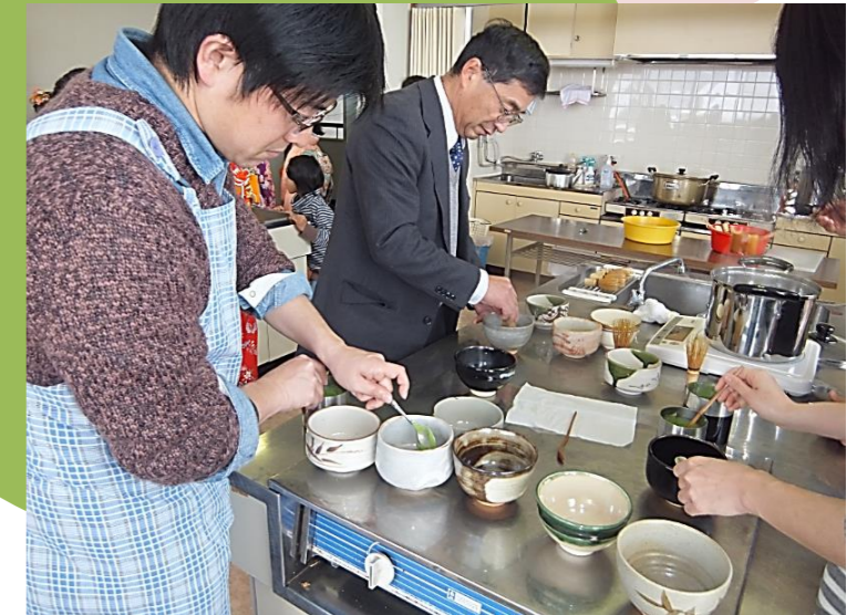
一般教室の受講者は、水屋にて美味しいお茶を点てます。