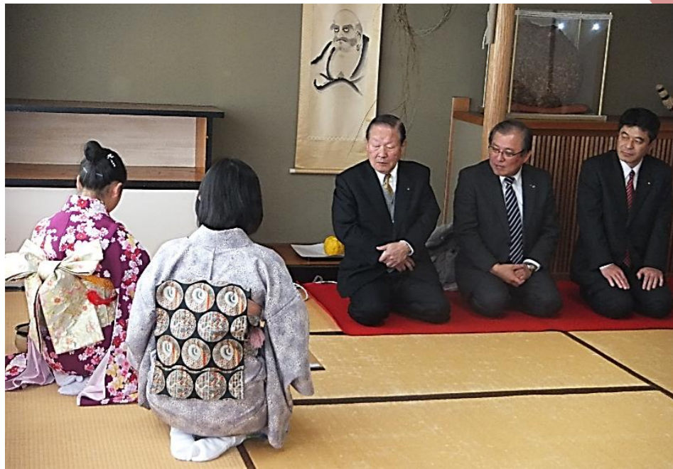
見事なお点前に感心する ご来賓の皆様。